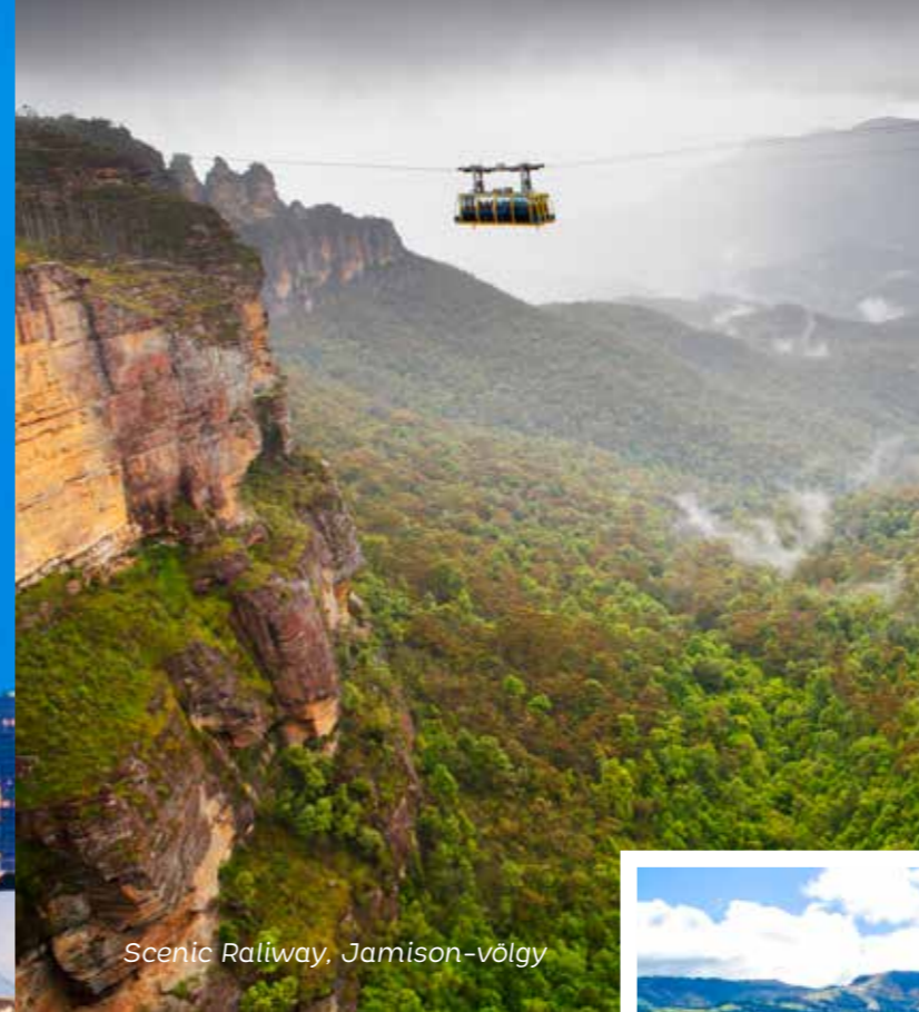
Scenic Raliway, Jamison-völgy

Egész napos kirándulás az UNESCO Világörökség részét képező Kék-hegységbe. A hegység a nevét onnan kapta, hogy az eukaliptusz fák olajos kipárolgása miatt alkalmanként keskes ködbe borul. Utazás a Jamison-völgybe a Scenic Raliwayen, amely a világ egyik legmeredekebb vasúti pályáján közlekedő vasúti szerelvénye. Ezt követően átkelés a völgy fölött 270 méter magasan, drótkötelpályán közlekedő felvonóval az Echo kilátóponthoz. Az utazás során lehetőség nyílik az eukaliptusz erdők, vízvezetések, szakadékok fényképezésére a teljes panorámát nyújtó kabinból. A hegység jelképe a „Három nővér” sziklaformáció, melyre az Echo pontról nyílik a legszebb kilátás. A Sydney-be